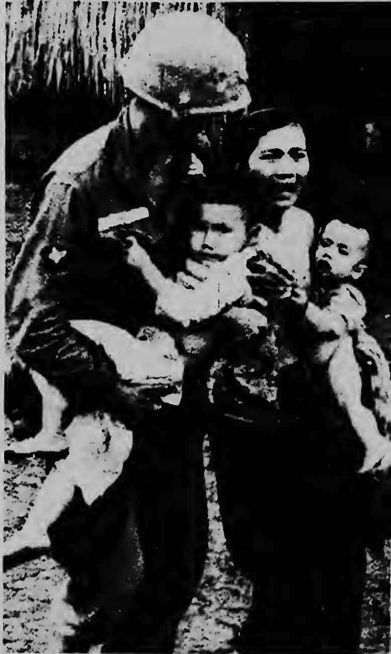
VUNG, TAU, SURVIETNAM -- Un paracaidista norteamericano ta yudando un muher vietnames cargando su dos yunan pa un lugar mas safe. Mientras tanto Viet Cong tabata ataca posicionnan local den cercanía.

Un vocero di EE.UU. a expresa cu den pasado comando norteamericano a mantene e política di sigui decisionnan di gobierno sudvietnames den cuestionnan e indole aki. El a confirma cu ordennan similar lo ser duna na e soldanan norteamericano.